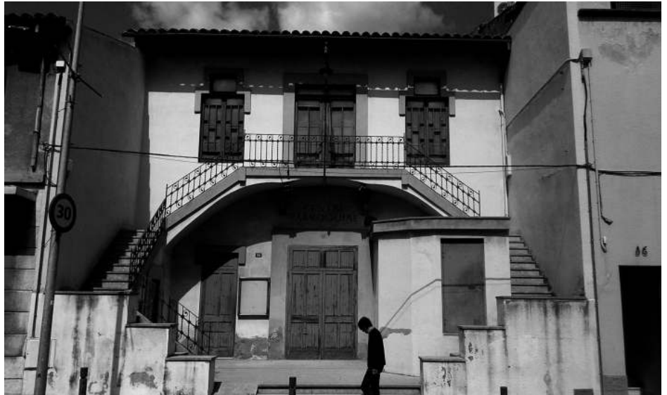
Façana del Centre Parroquial, on aviat començaran les obres

L'edifici del Centre Parroquial, en un inici Foment Catòlic, situat al carrer del Marquès de Peñaplata 14, data de l'any 1911 i ha tingut una llarga vida –més de 100 anys– durant la qual s'ha utilitzat com a centre associatiu, coral, sala de cinema, sala de teatre, audicions, conferències i altres activitats col·lectives que requereixen una capacitat aproximada màxima de fins a 250 persones. Aquestes necessitats s'han anat cobrint mitjançant una adaptació constant i un creixement de l'edifici en profunditat. Milliores realitzades amb mitjans modestos que tenen una vida en el temps més curta. Les deficiències i l'aparició de noves normatives han deixat obsolet l'edifici de cara a la utilització com a local de pública concurrència. Després de períodes cíclics de menor utilització, l'entusiasta revifada de la vida cultural, de grups de teatre i altres activitats, recomana una posada al dia que, ben mirat, hauria de ser extensiva a tot l'edifici i que