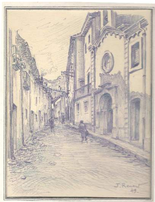
Dibuix de J. Renard (1949)

Capella del Socós: Els dies 7, 17 i 27 de cada mes a les 7 de la tarda rés del Rosari pregant per les vocacions i l'Any de la Fe.